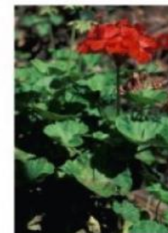
Geranio Parigino 3,00 €