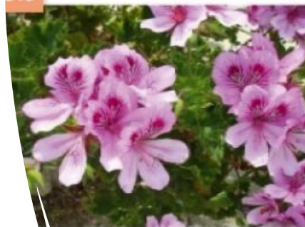
Geranio Imperiale 2.000 € 16,00 €