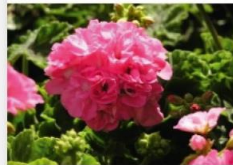
Geranio 2,50 €